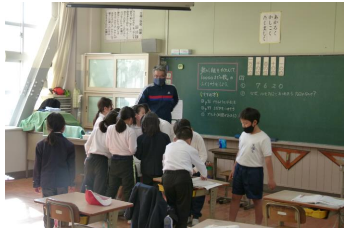
2年生：算数：10000までの数