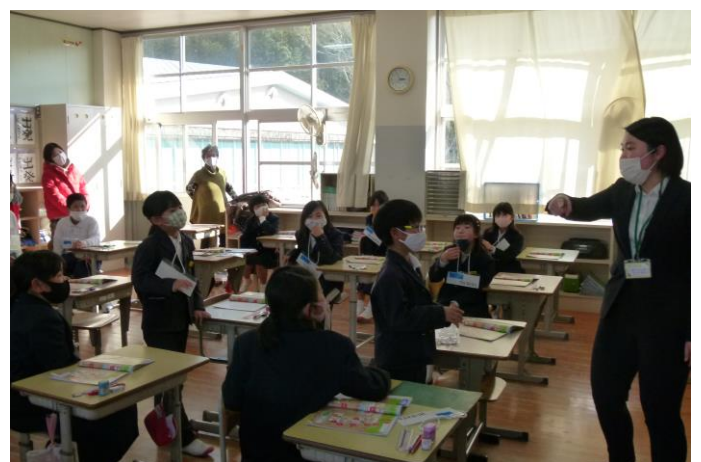
4年生：外国語活動：お気に入りの場所は？