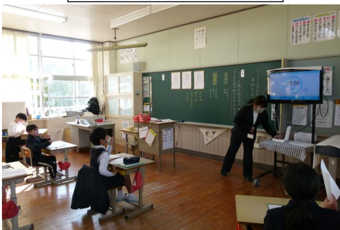
3年生：国語：音訓カルタ