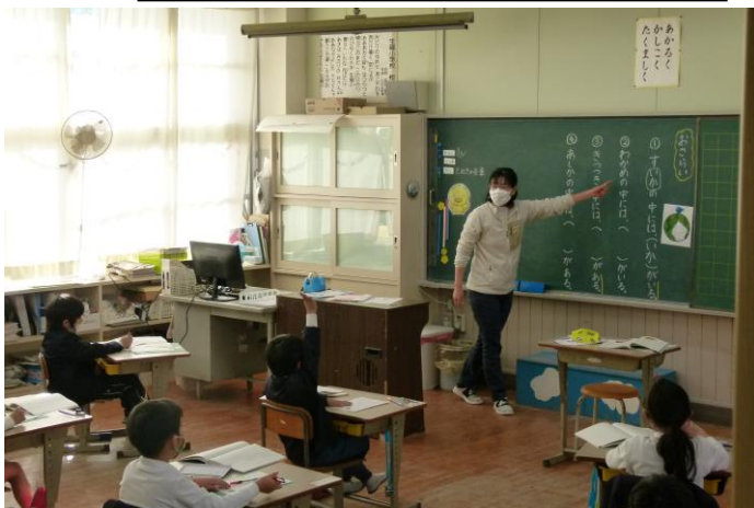
1年生：国語：ことばを見つけよう