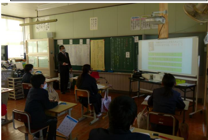
5年生：国語：想像力のスイッチを入れよう