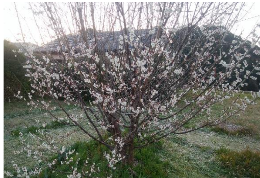
【福園公民館近くにある梅の木】

さて、進学・進級に向けて、1年間のまとめと次年度の準備に入ります。子どもたちにとっても、期待と不安の入り交じった複雑な時期となります。子どもたちの思いを大切にしながら温かい声かけをお願いいたします。